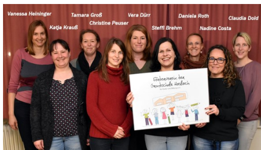
Vorstand seit März 2023